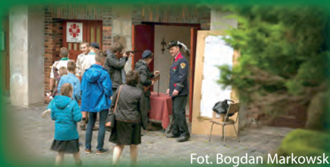
Fot. Bogdan Markowski