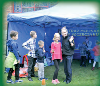
Ze Strażą Miejską na pewno bezpieczniej!