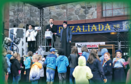
Uśmiech losu? Tak, ale...