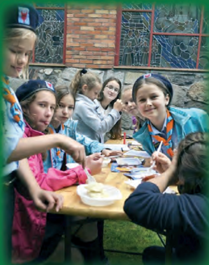
Skauści i „stół obfitości”