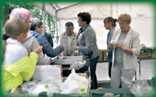
Co „przyniósł” los?