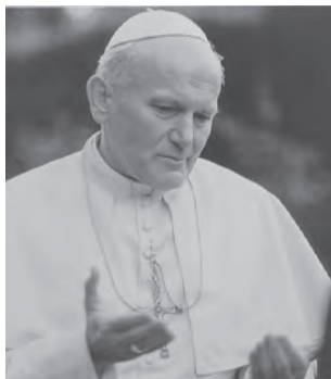
Fot. „JAN PAWEŁ II DZIEŃ PO DNIU”