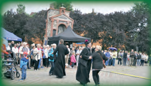
Tancerze w akcji