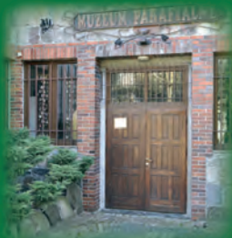
Za drzwiami historia ...