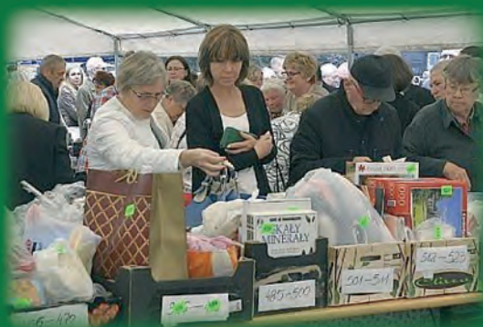
Gratka dla bibliofików