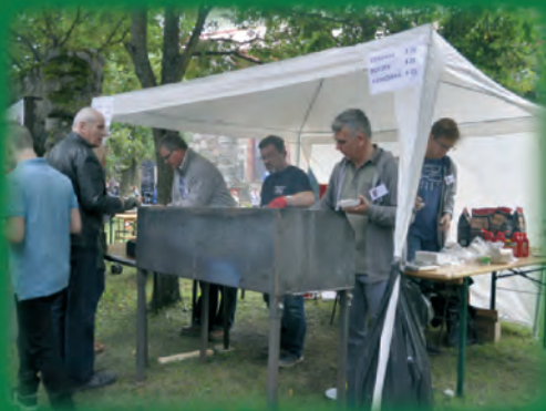
Coś z dymiącego rusztu...