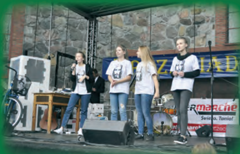
Oaza chwali Pana po swojemu